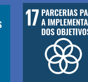
17 PARCERIAS PARA A IMPLEMENTAÇÃO DOS OBJETIVOS