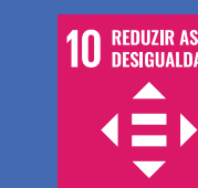
10 REDUZIR AS DESIGUALDADES