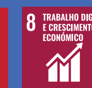
8 TRABALHO DIGNO E CRESCIMENTO ECONÓMICO