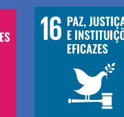
16 PAZ, JUSTIÇA E INSTITUIÇÕES EFICAZES